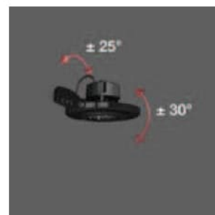
Decken- und Wandmontagebugel