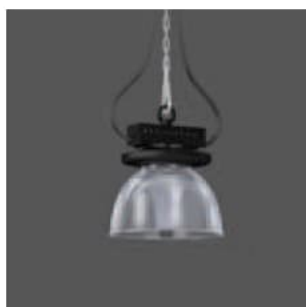
Abbildung mit Refraktor, DALI-Version