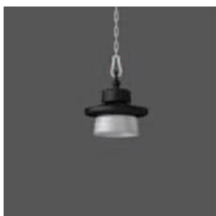
Abbildung mit Reflektor