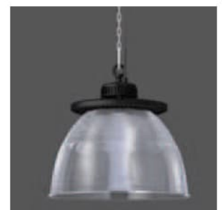
Abbildung mit Reflektor, DALI-Version