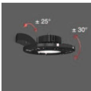
Decken- und Wandmontagebügel