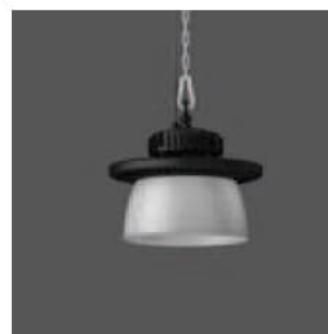
Abbildung mit Reflektor